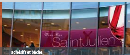
adhésifs et bâche