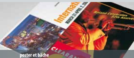
poster et bache