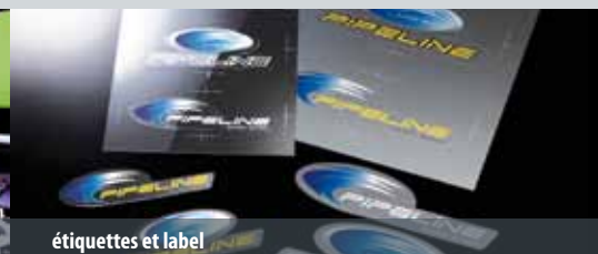
étiquettes et label