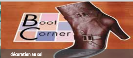
décoration au sol