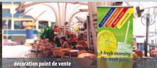
décoration point de vente