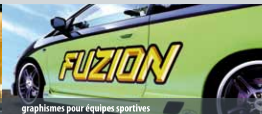
graphismes pour équipes sportives