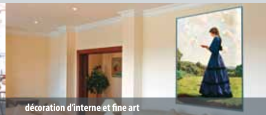
décoration d'intérieur et fine art