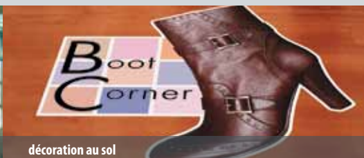
décoration au sol